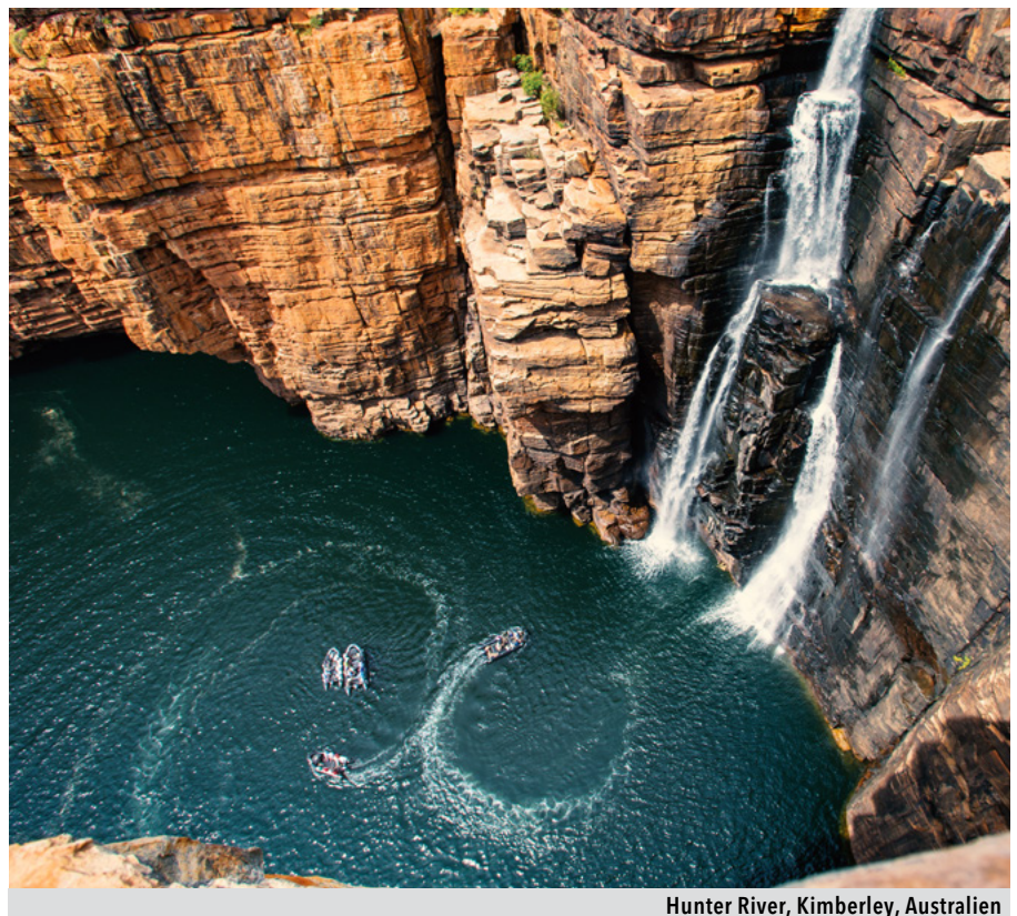
Hunter River, Kimberley, Australien

FÜR MEHR INFORMATIONEN KONTAKTIEREN SIE IHREN SALES-MANAGER ODER BESUCHEN SIE SILVERSEA.COM.